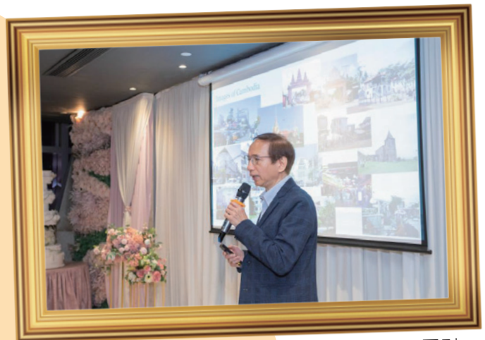
麥弟兄介紹學校規劃設計及圖則