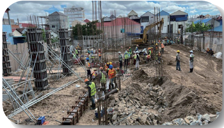
2022年10月 已完成地基工程，開始興建一樓