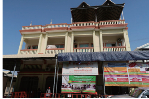
現時柬埔寨之光學校 (Sala Opheas Kampuchea)