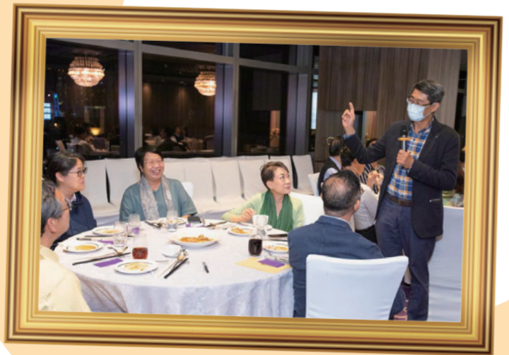
鄭醫生進行「突擊測驗」問答遊戲